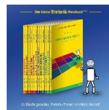
Kleine Knigge Reihe