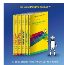
Kleine Knigge Reihe