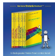
Kleine Knigge Reihe